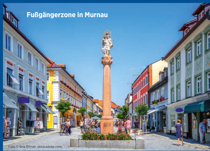
Fußgängerzone in Murnau